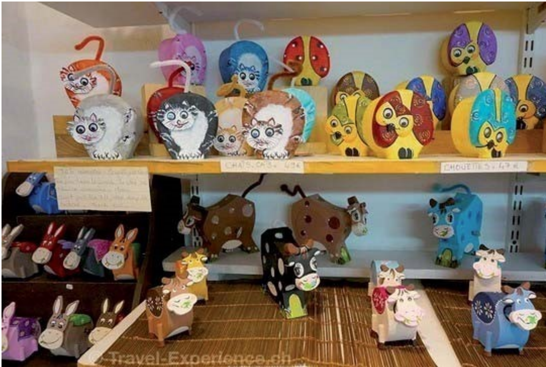
Die Musikdosen in der Scatt 'a Musica in Pigna.