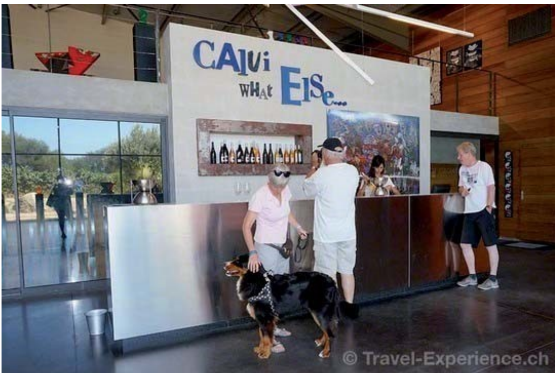
Weindegustation in der Domaine Clos Culombu – eine gute Empfehlung, what else?

Um uns einen Überblick über das Balagne-Gebiet zu verschaffen, fahren wir nach Madonna della Serra hinauf. Zwischen Meer und Berg erstreckt sich viel unberührt wirkende Natur und an der Bucht liegt Calvi mit seiner Festung und dem Hafen. Von den seltsamen Felsformationen, den Feigenkakteen am Strassenrand und den allgegenwärtigen alten Olivenbäumen sind wir sehr beeindruckt.