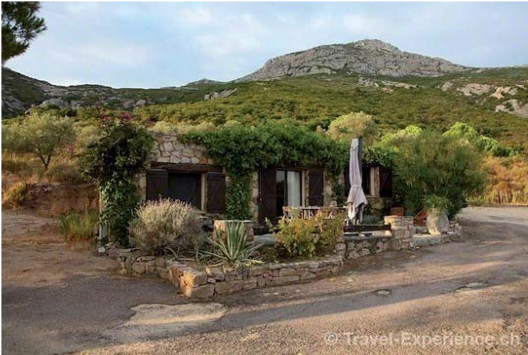
Unser Schäferhäuschen hoch über Calvi.