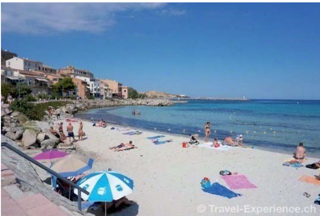
Ile Rousse hat auch einen herrlichen Strand...