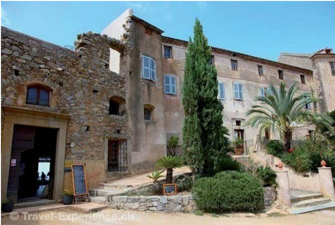
Im Künstlerdorf Pigna finden wir weit oben den Palazzu samt Hotel und Restaurant.