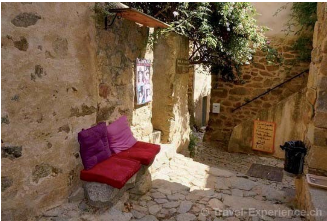
Eine künstlerische Gasse in Pigna.