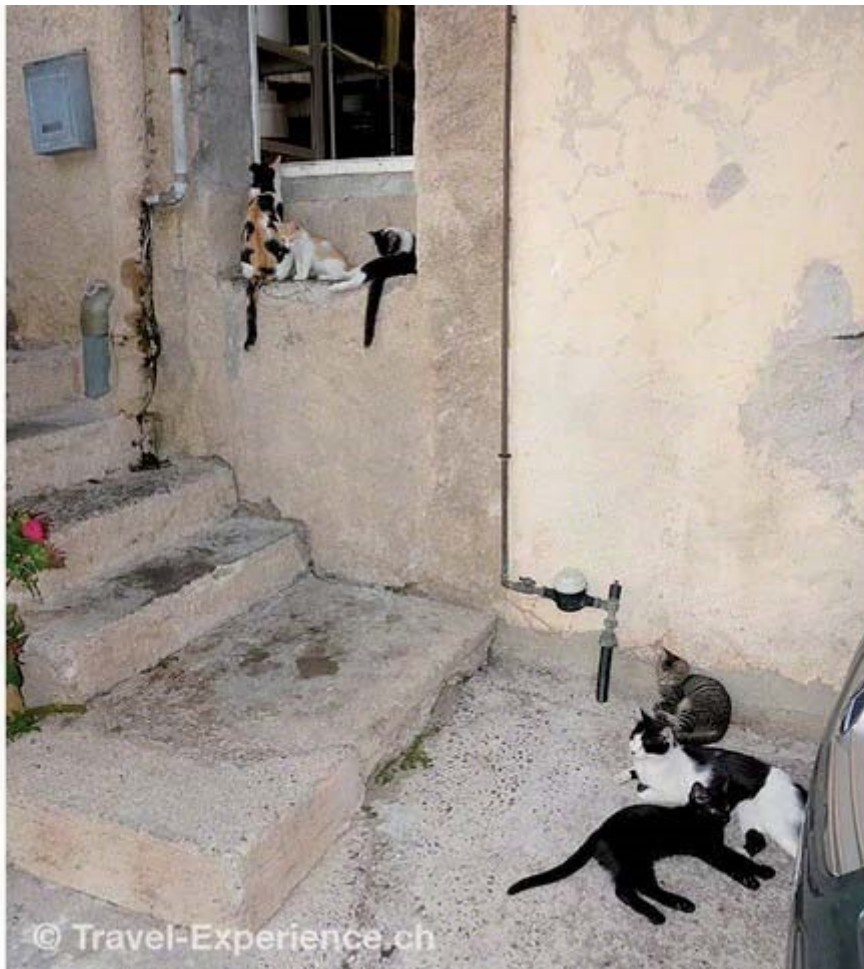
Algajola: Vor dem Küchenfenster eines Restaurants versammeln sich Katzen. Die wissen wohl ganz genau, dass sie her ab und zu ein Häppchen bekommen...