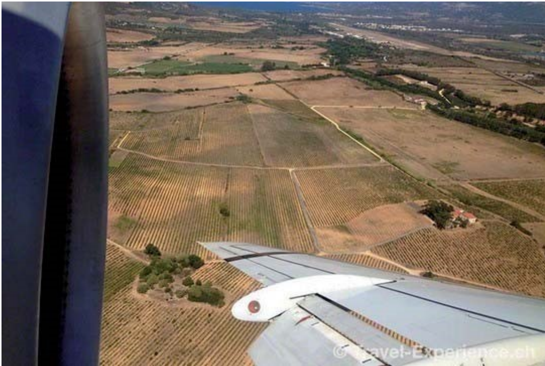
Windverhältnissen sei Dank: In einer 180-Grad-Steilkurve geht's Richtung Landepiste des Flughafens Calvi.