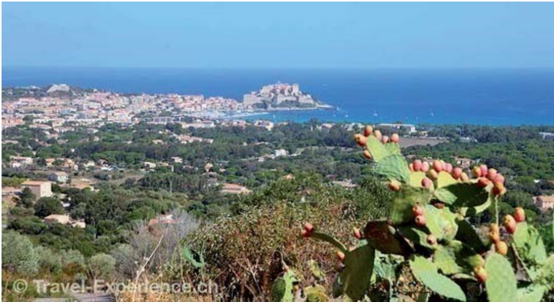
Die Sicht von Piazzili, unserer Unterkunft, auf Calvi.

Im Norden der Mittelmeerinsel treffen Meer und Berge, Natur und Städte, aber auch Kulinarik und Geniesser aufeinander.