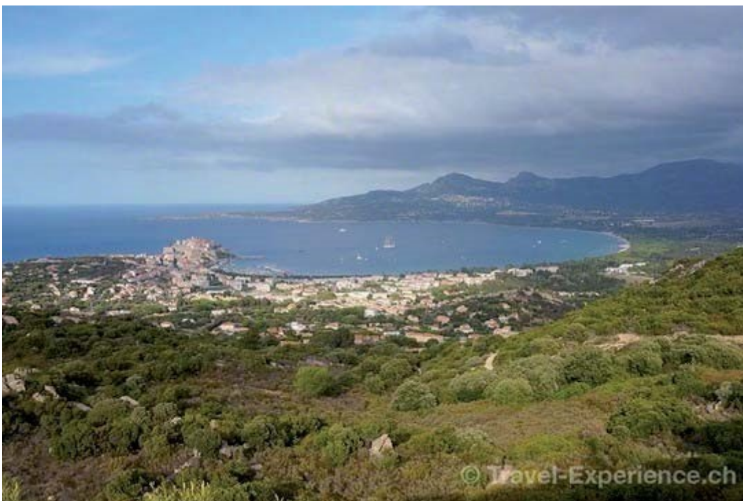
Von Madonna della Serra aus kann man die ganze Bucht bei Calvi überblicken.