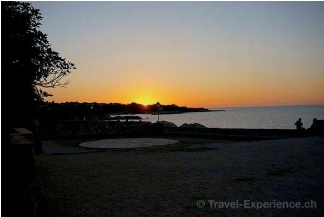
Sonnenuntergang in Algajola... Ein herrlicher Tag geht zu Ende!