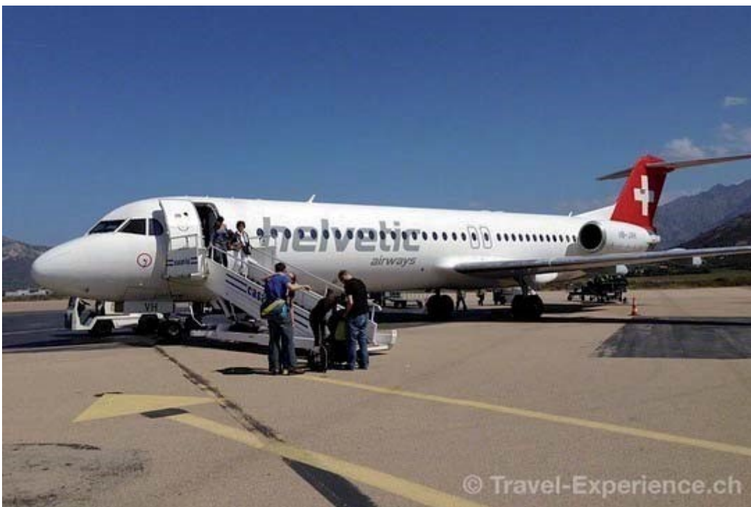
Sanft gelandet – die Helvetic-Piloten beherrschen das prima.