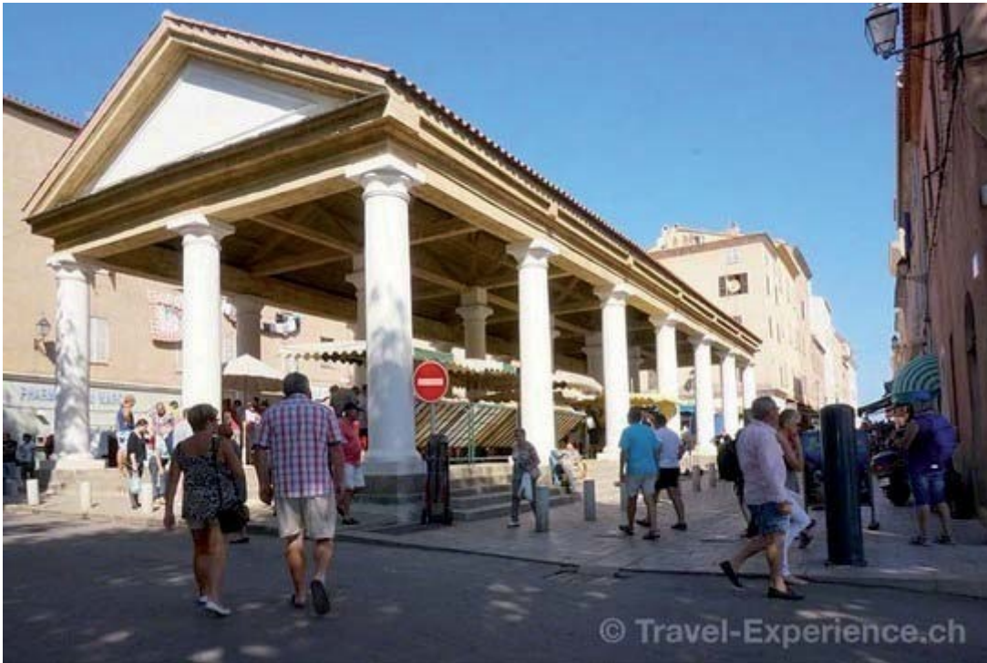
Markttag in der offenen Halle von Ile Rousse. Hier deckt man sich mit frischen Lebensmitteln ein.